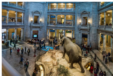
National Museum of Natural History