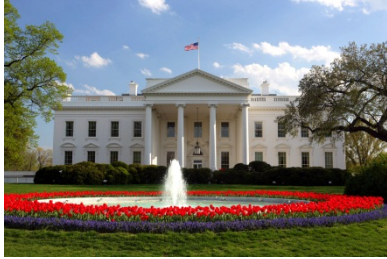
The White House

* 학교의 요청에 따라 일정을 계획할 수 있으며, 현지 상황에 따라 일정이 변경될 수 있습니다.