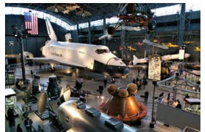
National Air & Space Museum