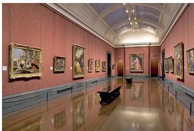
National Gallery of Art