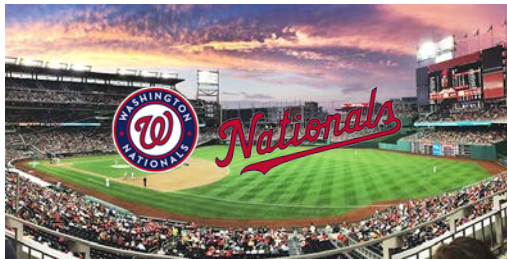
MLB (Major League Baseball)